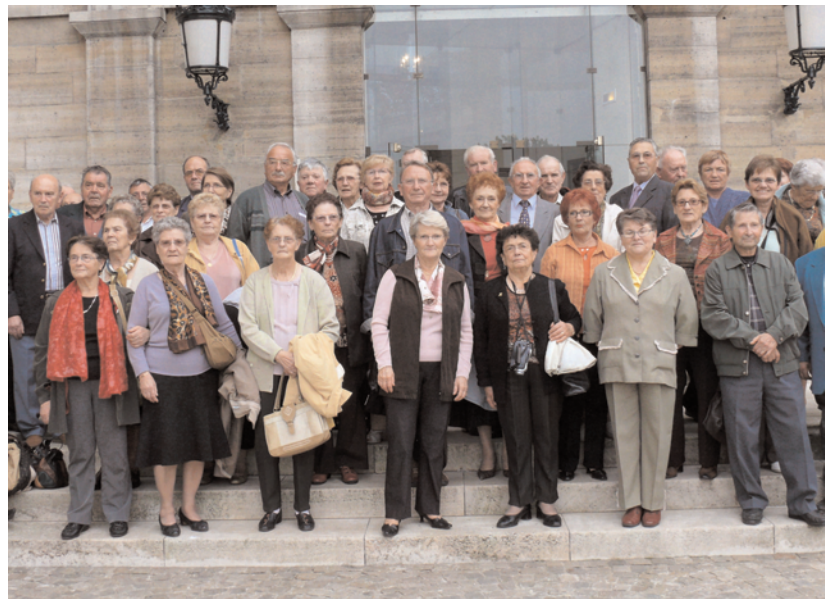
Le groupe de Richelais a également déjeuné avec le député